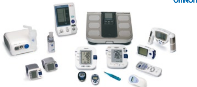
Merače krvného tlaku • Teplomery • Inhalátory • Merače telesného tuku TENS masážne prístroje • Krokometry

Intenzívny výskum a neustály vývoj zaručujú najlepšie riešenie pre každodennú starostlivosť o vaše zdravie v domácom prostredí.