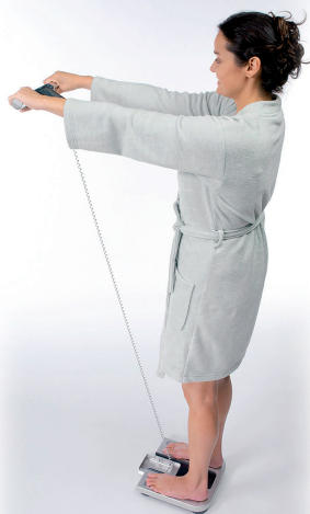
Ilustratívne foto spôsobu merania